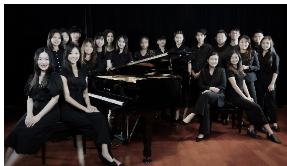
香港大學室內合唱團