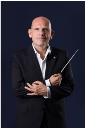
苑志登 香港管弦樂團音樂總監