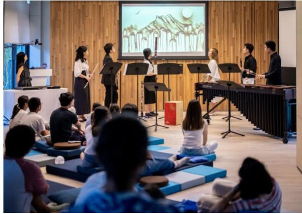
「舍區」室樂系列：「音樂新晉薈萃」- 超越新領域 場地伙伴：鯽魚涌海濱社區空間「舍區」