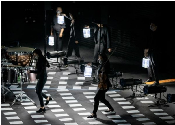
「音樂新晉薈萃」- 超越新領域：海闊天空音樂劇場 合辦：西九文化區自由空間