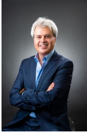
盛韻奇 香港演藝學院音樂學院院長