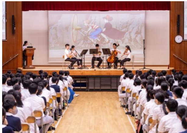
田家炳中學社區外展表演 特別鳴謝：田家炳基金會