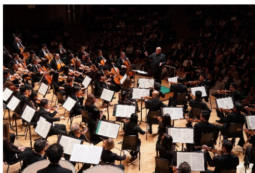
香港管弦樂團

三場免費音樂會之登記詳情將於 2022 年 4 月 22 日（星期五）公布，詳情請瀏覽 香港管弦樂團網站 。音樂會招待 6 歲及以上人士。